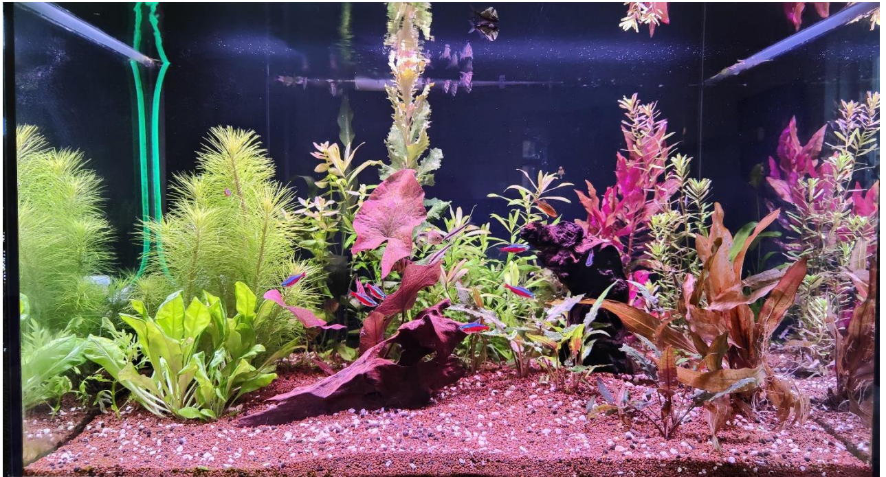
Het aquarium in de huiskamer van Aad