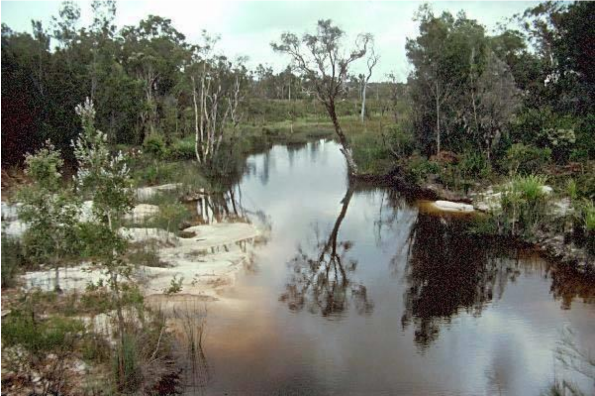
Een plaatje van een biotoop waar P. mellis gevonden wordt