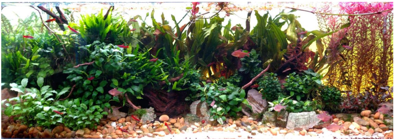
Het aquascape aquarium van Nico