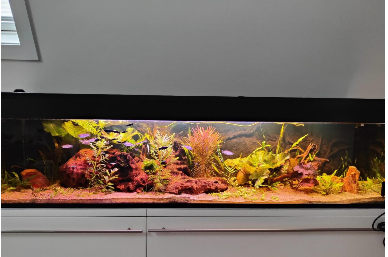
Het aquarium op de zolder van Aad.

Tegenwoordig houden we 1 x in het halfjaar een praatavond aan de hand van ingezonden foto's van aquaria, problemen, bewoners, planten enz. onderstaand de inzendingen van afgelopen december: