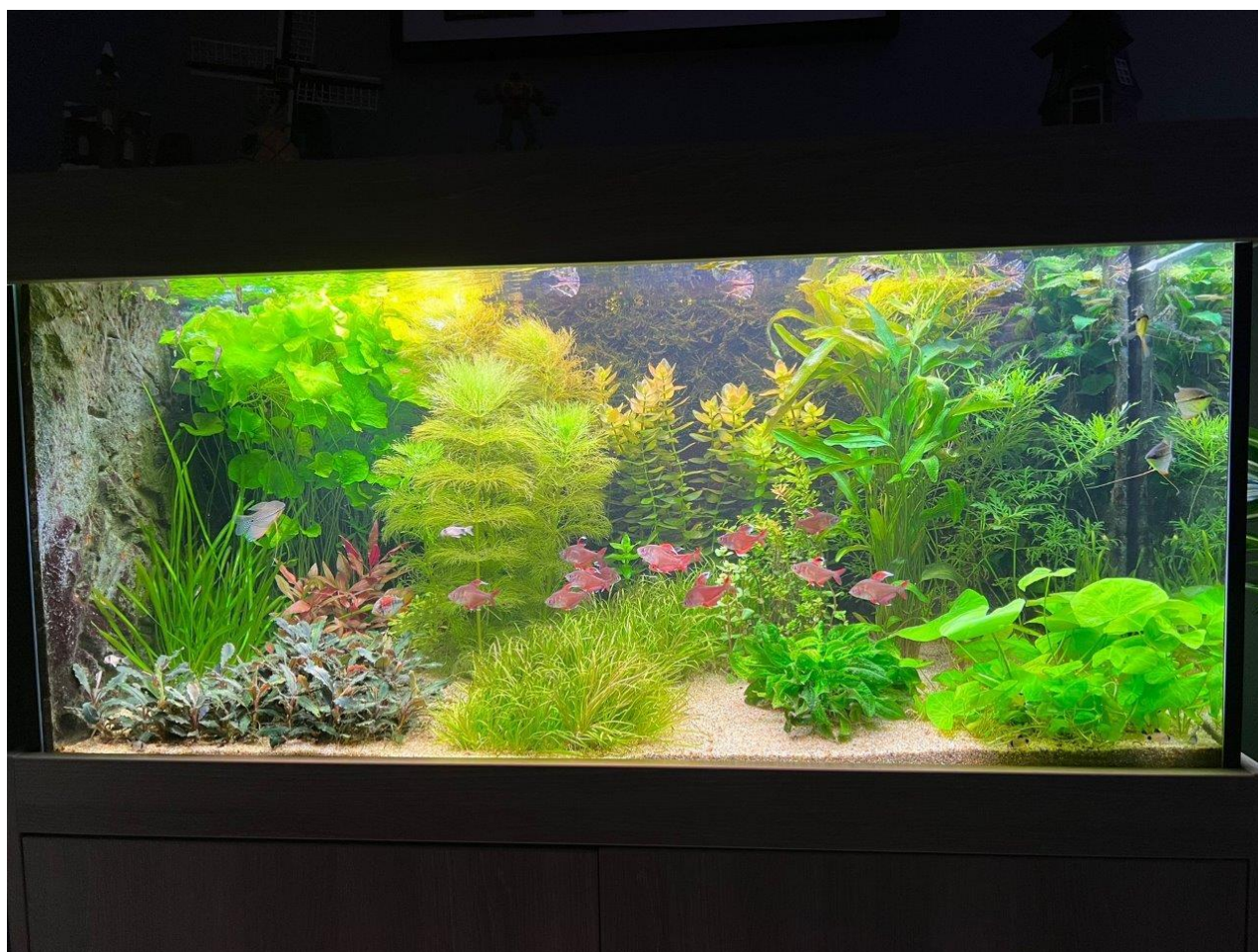
Het aquarium van Teun