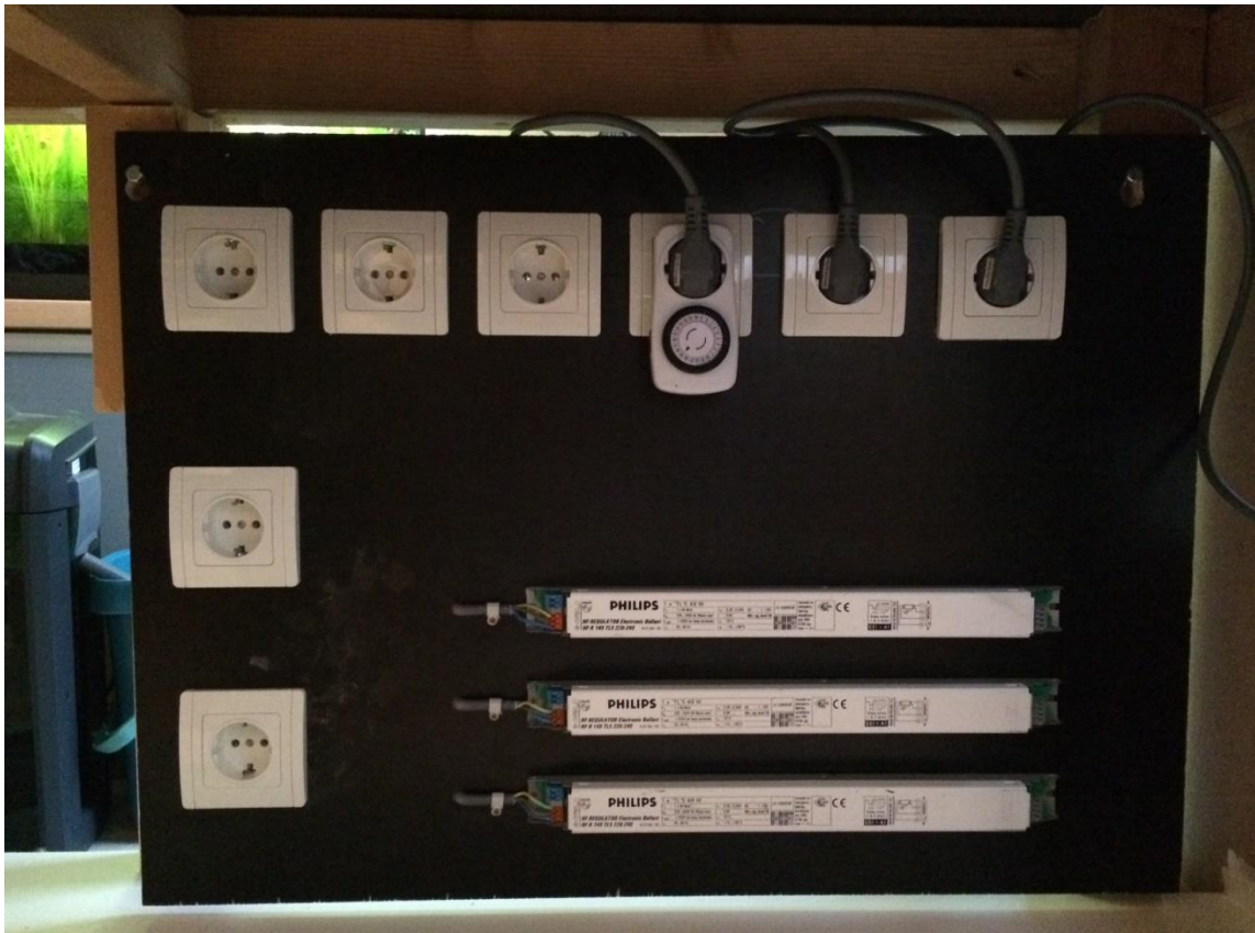
Elektra in voorbereiding.