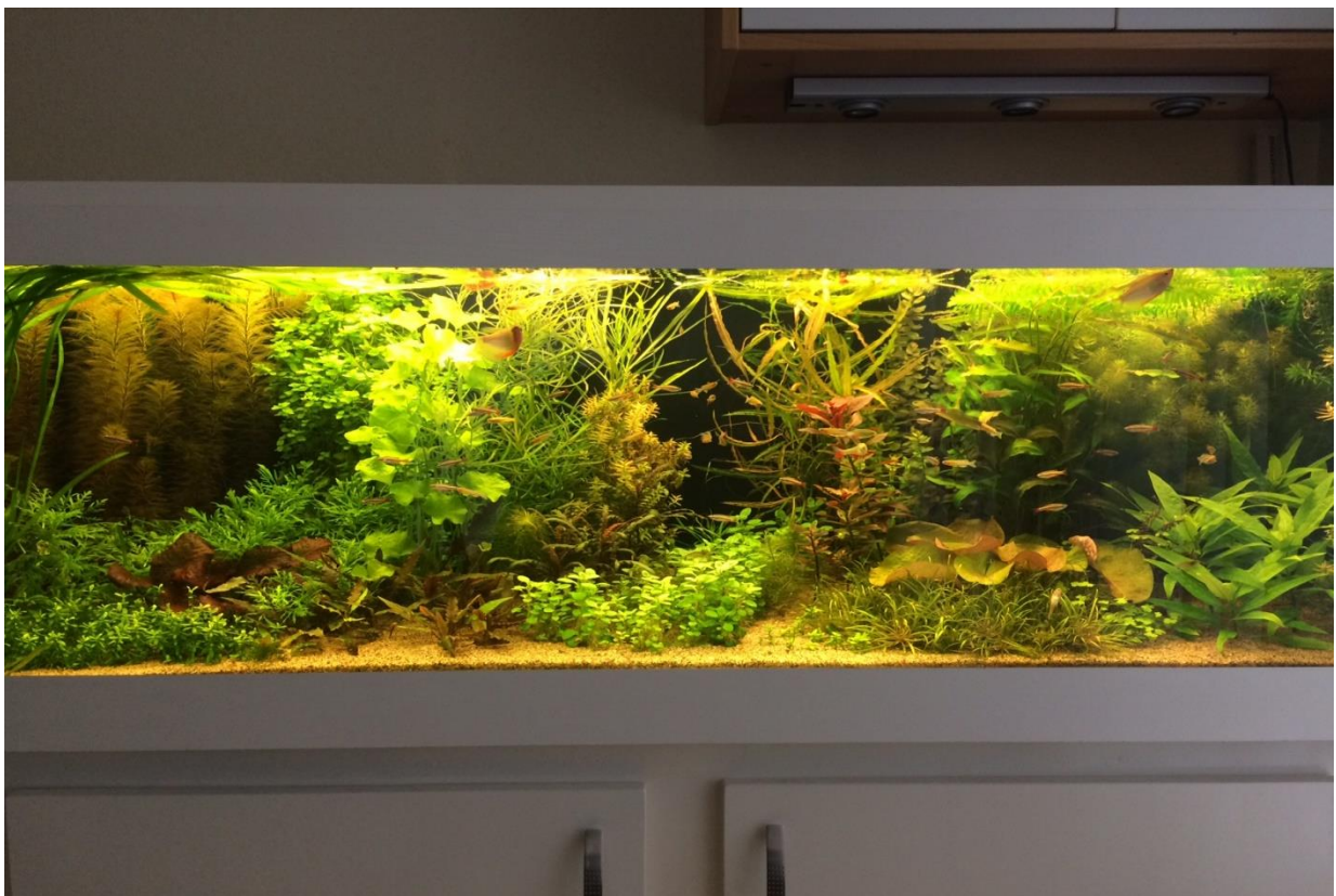
De bak ingericht.