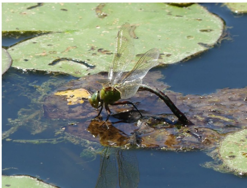
Vrouwtje Keizerlibel ei-afzettend

Glazenmakers en Keizerlibellen lijken op het eerste gezicht erg op elkaar, en zijn op de Grote Bronlibel na de grootste van Nederland. Ze kunnen bij mooi weer erg hard vliegen en zijn daarom moeilijk te vangen (met je camera). Als je 's zomers bij een sloot of een ven staat komt er altijd wel eentje voorbij zoeven op zoek naar voedsel.