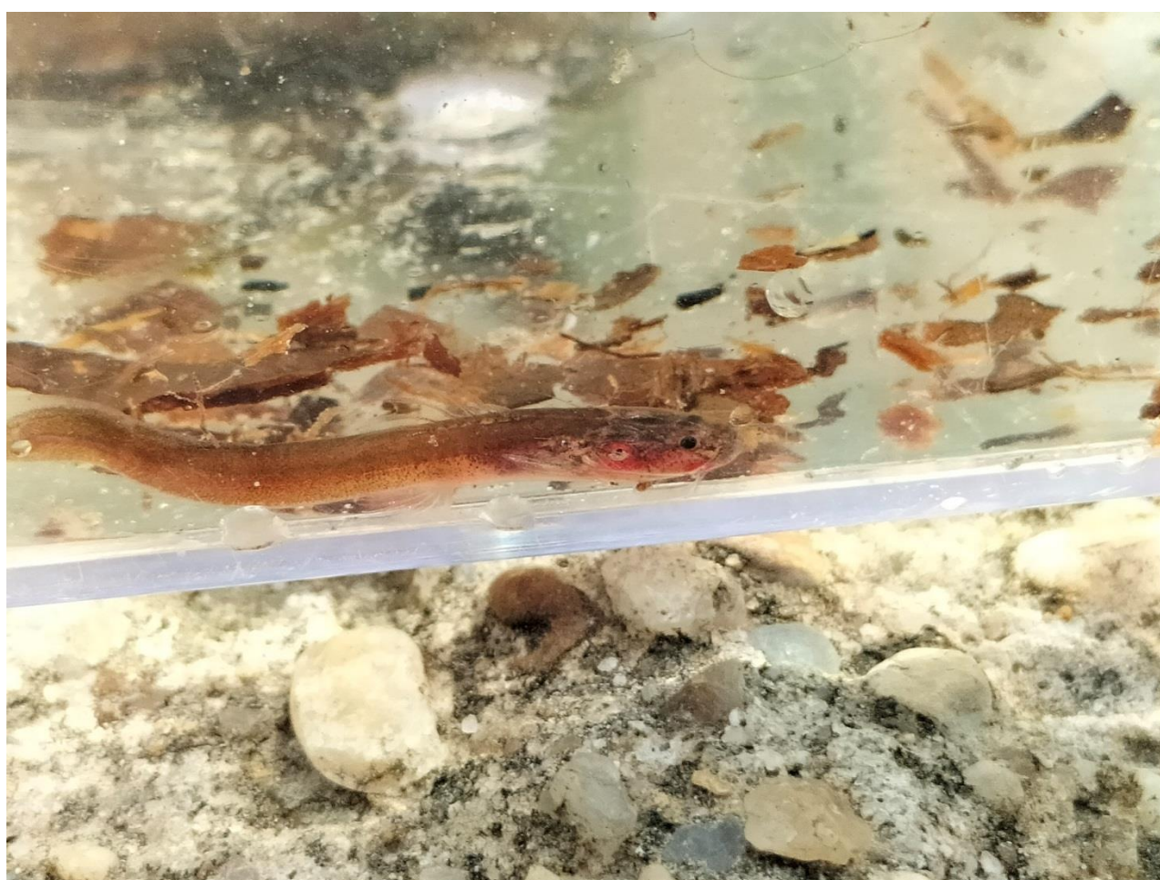
Het gevonden meervalletje in Colombia. Waarschijnlijk een Myoglanis-achtige

Behalve mooie en leuke visjes zijn er natuurlijk ook een hoop mindergeliefde Dieren te vinden met name in de vorm van insecten. Op een gegeven moment vingen we een klein slangachtig meervalletje en werd er uit de groep gevraagd of dit misschien het beruchte meervalletje was wat je urinebuis in kan kruipen om daar te parasiteren. Dat kon ik ontkennen want we zijn de beruchte meervalletjes wel eens tegen gekomen tussen de otocinclus uit Brazilië wat ook weer een waarschuwing kan zijn voor iedereen die otocinclus in zijn aquarium heeft zwemmen.